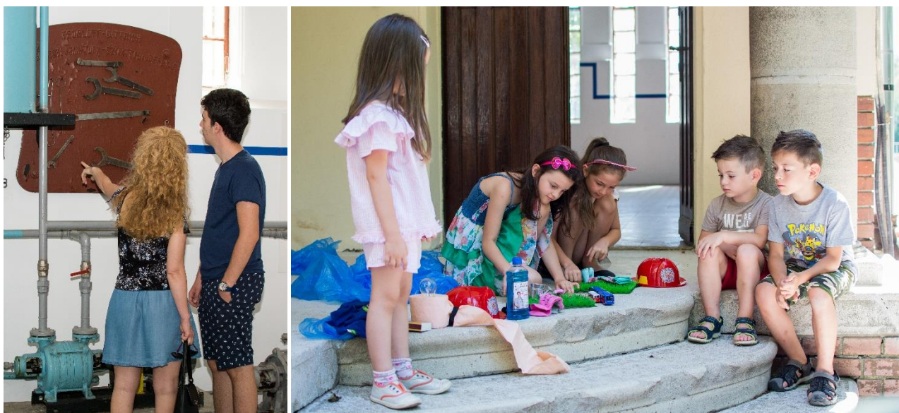
Foto: Programul Descoperiți poveștile apei , la Uzina de apă industrială,