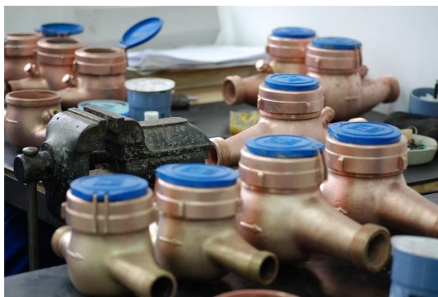
Foto: Contoarele de apă, verificate în programul de scadență metrologică