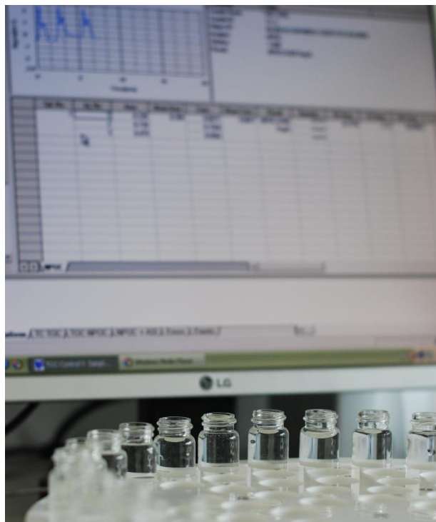
Foto: Apa de la robinetele timișorenilor este testată zilnic în laboratorul Aquatim